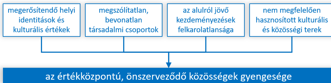
2. ábra Fejlesztési szükségletek